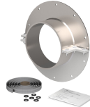
SLFO/Ext manşon kiti

Ayrıntılı bilgi için lütfen roxtec.com adresini ziyaret edin.